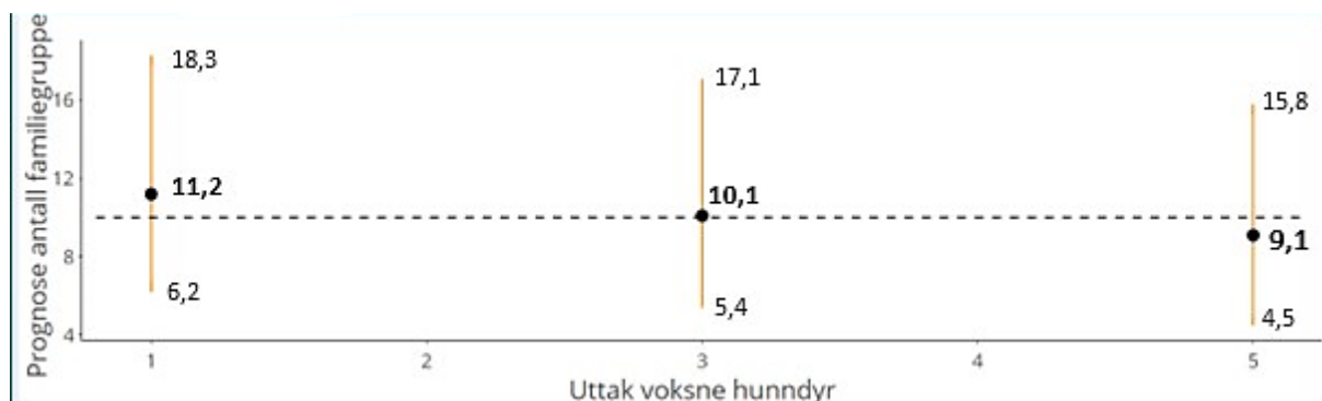
Figur 1: Prognose og usikkerhetsintervall på 75 % for antall familiegrupper på landsbasis før jakta i 2025 gitt tre ulike scenarier for uttak av voksne hunndyr under jakta i 2024 for region 8 (henholdsvis 1, 3 og 5 voksne hunndyr). Stiplet linje angir bestandsmålet på 10 familiegrupper.

havner på det regionale bestandsmålet også før jakta i 2025. Ved et uttak av 5 hunndyr beregner modellen 9,1 familiegrupper (figur 1).